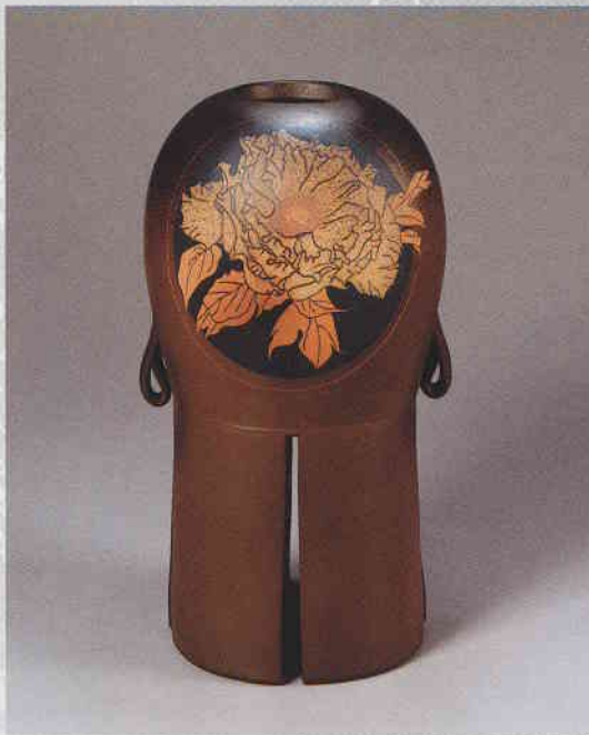
今井政之「象嵌彩窯変 丸紋薫華 長壺」2003年

現在 日本芸術院会員 国際陶芸アカデミー会員 社団法人日展常任理事 京都府文化財団理事 京都府工芸美術作家協会会員 ベルギー共和国クスコ美術学校客員名誉教授 大阪市立美術館運営委員